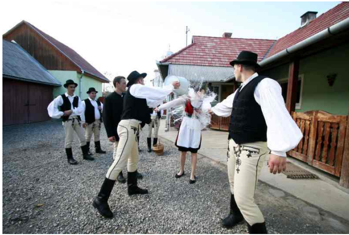
Fig. 3. – Mireasă la udat

Colindatul continua cu „ Gratulatul ” care avea loc în ajunul sărbătorilor Sfinților Ștefan (27 decembrie), Vasile (1 ianuarie) și Ioan (7 ianuarie) și era adresat celor care purtau nume de sfinți, și erau răsplățiți cu vin și prăjituri.