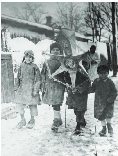
Fig. 1. – „Steaua” (www.wikipedia.ro)

Astfel, copiii porneau dimineața cu steaua, împărțiți în cete, așa cum era împărțit satul, cu mare grijă să nu treacă pe teritoriul altei cete.