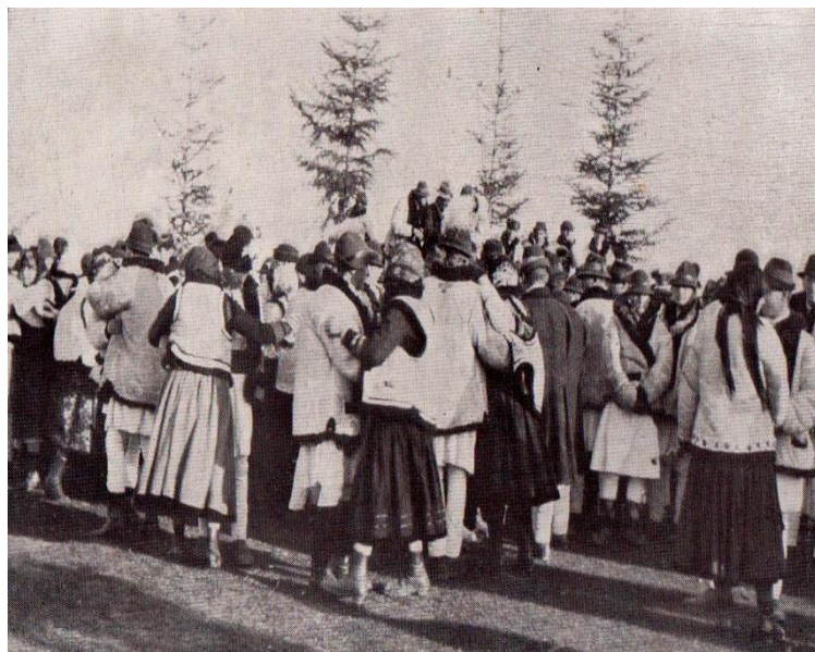
Fig. 2. – Joc tradițional românesc

Tradiția spune că după aceea, cu mic cu mare, îmbrăcați în haine de sărbătoare, ieșeau în mijlocul satului, unde începea jocul românesc (fig. 2.) și avea loc un alt obicei: „ Udatul ”.